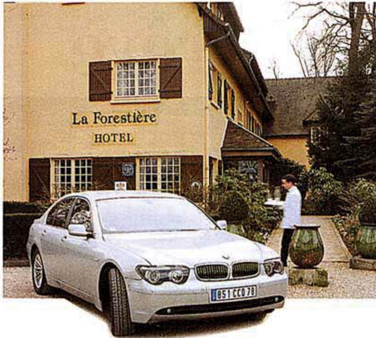
Comme une conjugaison harmonieuse d'élégance et de force, la rencontre de la nouvelle 745i avec cette région chargée d'histoire est un symbole.